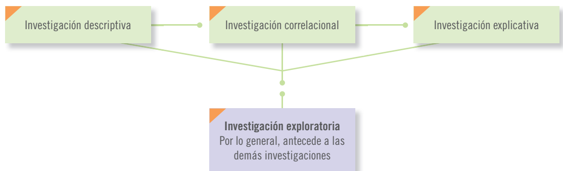
Figura 5.2 Alcances de la investigación.

Los estudios exploratorios sirven para preparar el terreno y por lo común anteceden a investigaciones con alcances descriptivos, correlacionales o explicativos. Los estudios descriptivos —por lo general— son la base de las investigaciones correlacionales, las cuales a su vez proporcionan información para llevar a cabo estudios explicativos que generan un sentido de entendimiento y son altamente estructurados. Las investigaciones que se realizan en un campo de conocimiento específico pueden incluir diferentes alcances en las distintas etapas de su desarrollo. Es posible que una investigación se inicie como exploratoria, después puede ser descriptiva y correlacional, y terminar como explicativa (figura 5.2).